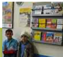
We openen deuren van een nieuwe wereld bij u om de hoek

Nederland heeft 3,1 miljoen allochtonen met 192 nationaliteiten waarvan 1,7 miljoen niet-westers ■ In 2050 heeft een derde van de bevolking een niet-Nederlandse achtergrond waarvan 3,5 miljoen niet-westers zal zijn ■ Aandeel allochtonen in de drie grote steden ligt thans rond de 50 procent ■ Een op de dertien huwelijken is gemengd, in de grote steden een op de drie ■ Een op de acht schoolverlaters is van allochtone afkomst, in de grote steden een op de twee ■ Een kwart van alle nieuwe bedrijven wordt door allochtonen gestart ■ Van de beroepsbevolking is ongeveer een op de vijf allochtoon ■ Nederland kent ruim 800.000 analfabeten van autochtone afkomst en 400.000 van allochtone afkomst ■ Koopkracht van niet-westerse allochtonen is ruim 14 miljard euro per jaar ■