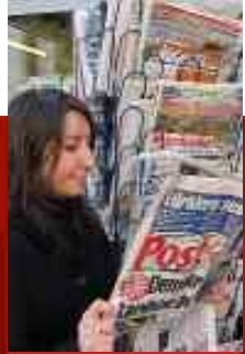
Wij zorgen voor uw advertentie in relevante media