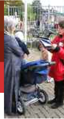
Grootschalig onderzoek op straat