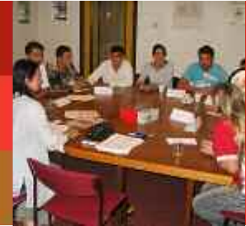
Een groepsgesprek voor, door en met uw doelgroep